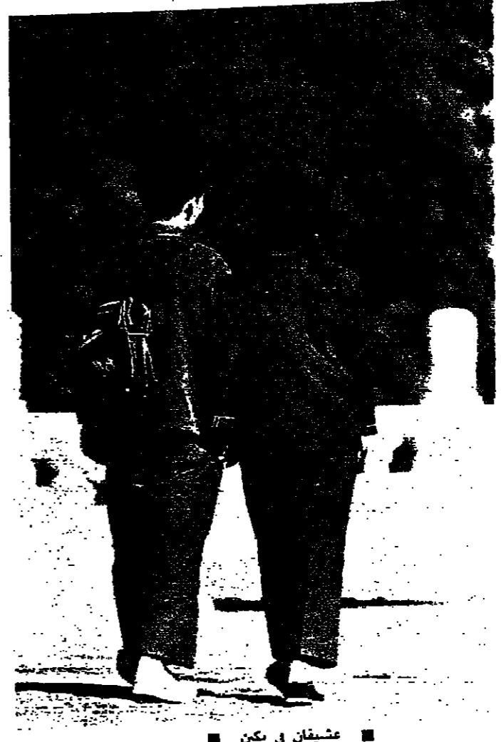
العواطف تضطرم على أسوار الصين